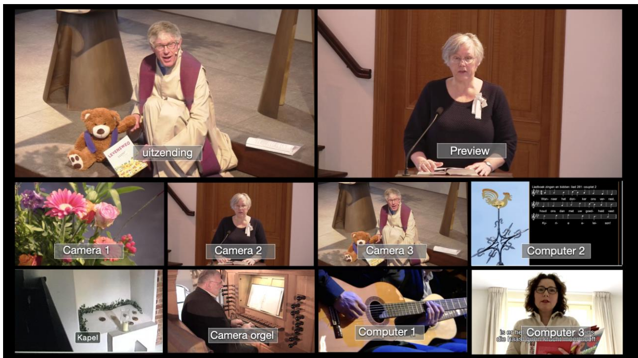
De beeldbronnen waaruit de regie kan kiezen.