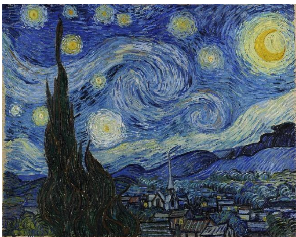
Vincent van Gogh: 'Sterrennacht'