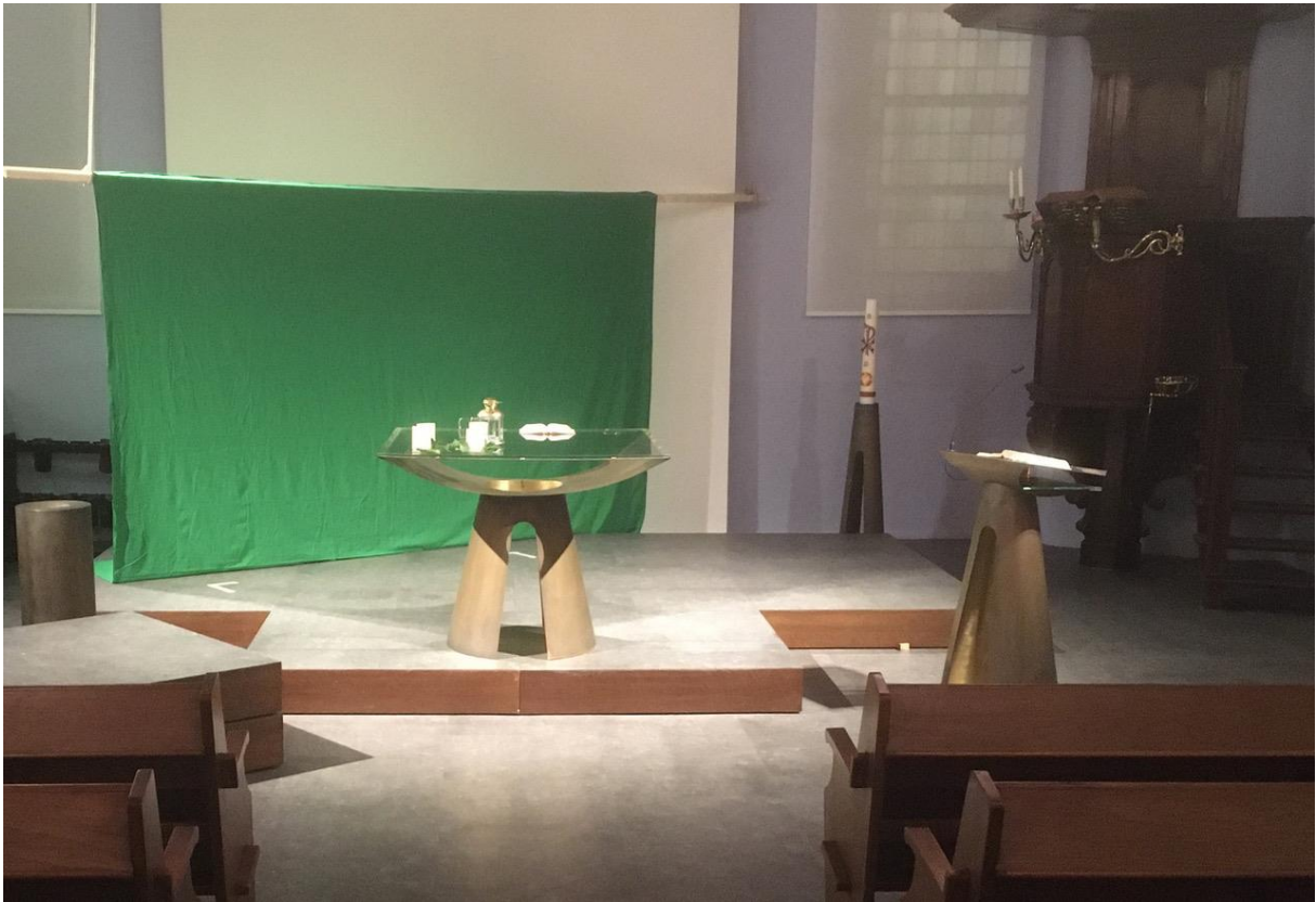
Het groene scherm in de kerk