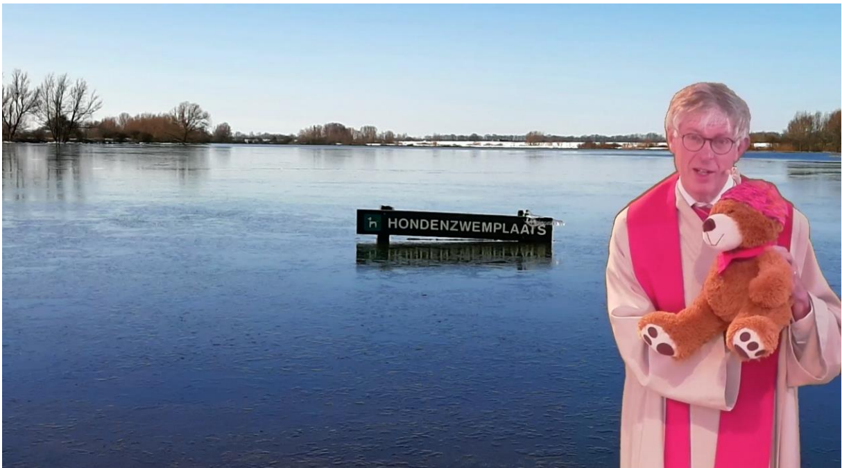
Met dominee beer bij de hondenzwemplaats